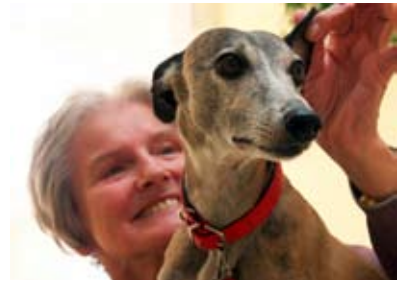
Whippet-Hündin Xena „bei der Arbeit“

Netzwerke sind die Antwort auf die Forderung zur Umstrukturierung, sie schaffen vor allem Verhandlungsstärke gegenüber Vertragspartnern. Wir sollten die Chance nutzen, unsere Strukturen selbst zu bestimmen und zu gestalten, bevor sie uns durch andere aufgezwungen werden. Das erfordert Arbeitseinsatz von engagierten Mitstreitern. Und dass den nichtärztlichen Mitarbeitern in den Praxen hier eine ganz wichtige Rolle zukommt, dürfte sich auch herumgesprochen haben. Kommunikation ist ein hilfreiches Mittel dabei. Wir arbeiten daran!